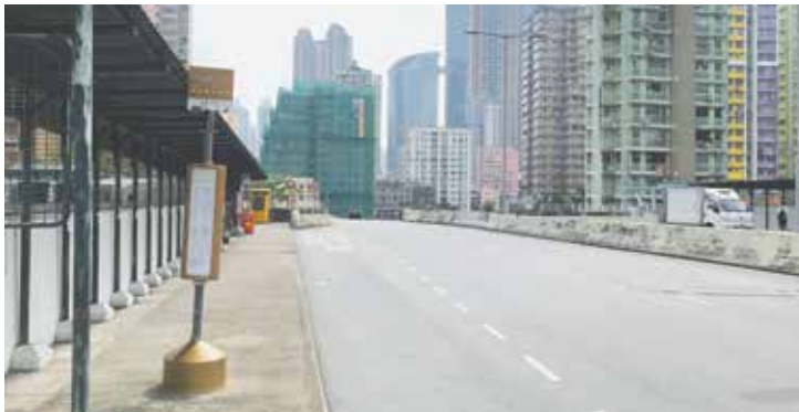
* 荃灣港鐵站上落客點站為大河道北南行停車灣 Boarding point of Tsuen Wan Station at Tai Ho Road North southbound