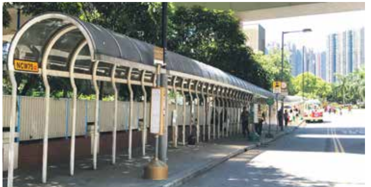
# 荃灣西鐵路站上落客點站為大河道 (西鐵站D出口對面公共小巴士) Boarding point of Tsuen Wan West Station at Tai Ho Road (Minibus Stop at the opposite to Exit D)