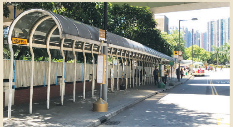
* 荃灣西鐵站上落客點站為大河道 (西鐵站D出口對面公共小巴站) Boarding point of Tsuen Wan West Station at Dai Ho Road (Minibus Stop at the opposite to Exit D)