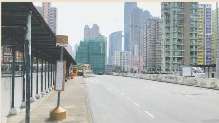
* 荃灣港鐵站上落客點站為大河道北南行停車灣 Boarding point of Tsuen Wan Station at Dai Ho Road North southbound